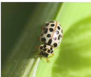
Nittenprykket mariehøne* Anisosticta novemdecimpunctata Lengde: 3 - 4 mm Habitat: Våtmark, takrør/ dunkjevle Slekten har 2 arter i Norge