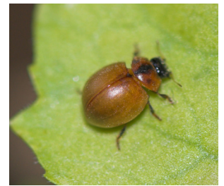
Vingeløs mariehøne* Cynegetis impunctata Lengde: 3 - 4,5 mm Habitat: Gresseng Slekten har 1 art i Norge