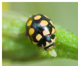
Svart fjortenprykket mariehøne* Coccinula quatuordecimpustulata Lengde: 3 - 4 mm Habitat: Gresseng Slekten har 1 art i Norge