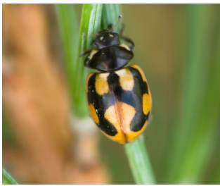
Hieroglyfmariehøne* Coccinella hieroglyphica Lengde: 4 - 5 mm Habitat: Lynghei Slekten har 6 arter i Norge