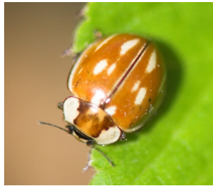
Stripet mariehøne* Myzia oblongoguttata Lengde: 6 - 8 mm Habitat: Nåletrær Slekten har 1 art i Norge