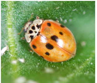
Tipprykket mariehøne* Adalia decempunctata Lengde: 4 - 5 mm Habitat: Busker, skoglandskap Slekten har 3 arter i Norge