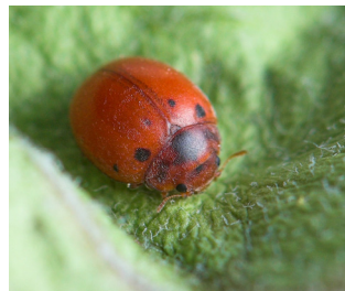
Tjuefireprykket mariehøne Subcoccinella vigintiquatuorpunktata Lengde: 3 - 4 mm Habitat: Gresseng Slekten har 1 art i Norge