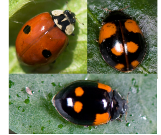
Topprykket mariehøne Adalia bipunctata Lengde: 3,5 - 5,5 mm Habitat: Generalist Slekten har 3 arter i Norge