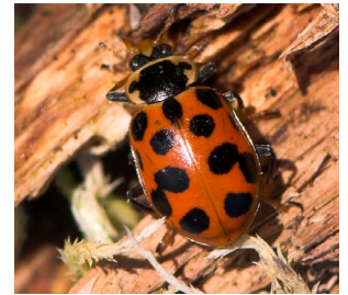
Trettenprykket mariehøne* Hippodamia tredecimpunctata Lengde: 4,5 - 7 mm Habitat: Våtmark Slekten har 5 arter i Norge