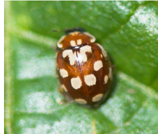
Åttenprykket mariehøne* Myrrha octodecimpunctata Lengde: 3,5 - 6 mm Habitat: Nåletrær Slekten har 1 art i Norge