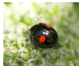
Chilocorus renipustulatus Lengde: 3 - 4,5 mm Habitat: Løvfellende trær Slekten har 2 arter i Norge