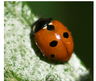
Femprykket mariehøne Coccinella quinquepunctata Lengde: 3 - 5 mm Habitat: Generalist Slekten har 6 arter i Norge