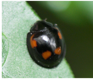
Exochomus quadripustulatus Lengde: 3 - 5 mm Habitat: Nåletrær Slekten har 1 art i Norge