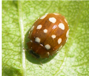
Fjortenprykket mariehøne Calvia quatuordecimpunctata Lengde: 4,5 - 6 mm Habitat: Løvfellende trær Slekten har 3 arter i Norge