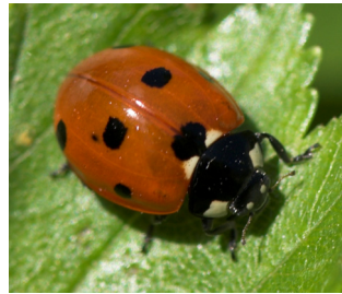
Syvprykket mariehøne Coccinella septempunctata Lengde: 5 - 8 mm Habitat: Generalist Slekten har 6 arter i Norge