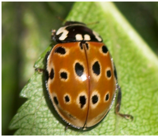
Øyeflekket mariehøne* Anatis ocellata Lengde: 7 - 9 mm Habitat: Nåletrær Slekten har 1 art i Norge