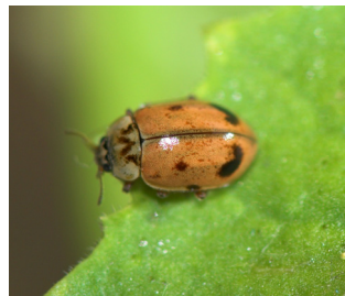
Aphidecta obliverata Lengde: 3,5 - 5 mm Habitat: Nåletrær Slekten har 1 art i Norge