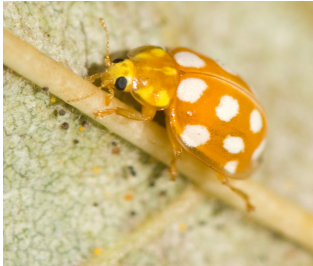
Sekstenprykket mariehøne* Halyzia sedecimpunctata Lengde: 5 - 7 mm Habitat: Løvfellende trær (eks. Ask) Slekten har 1 art i Norge