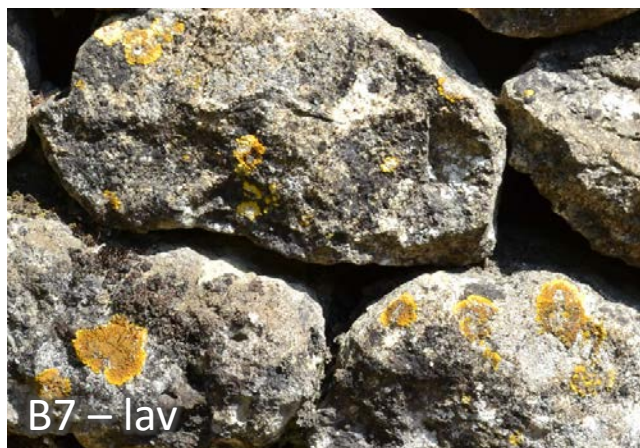
B7 – lav