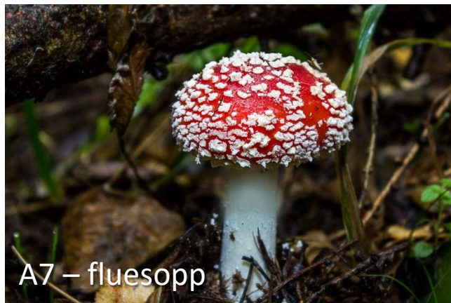
A7 – fluesopp