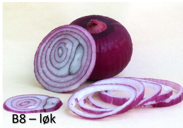
B8 – løk