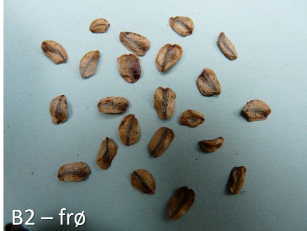
B2 – frø