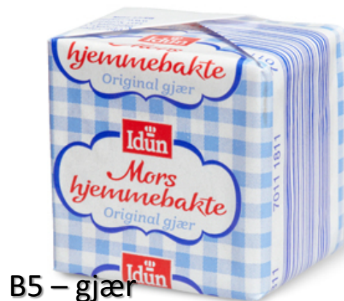
B5 – gjær