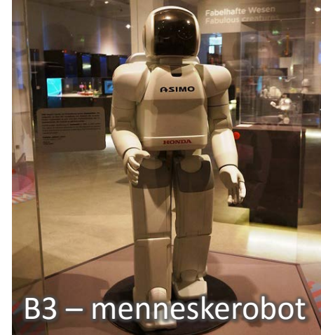
B3 – menneskerobot