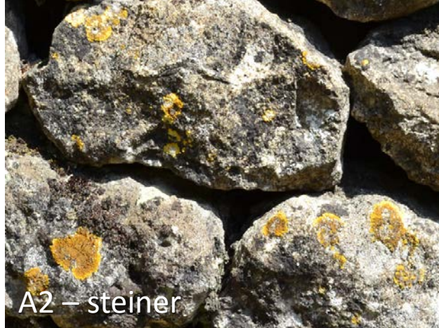
A2 – steiner