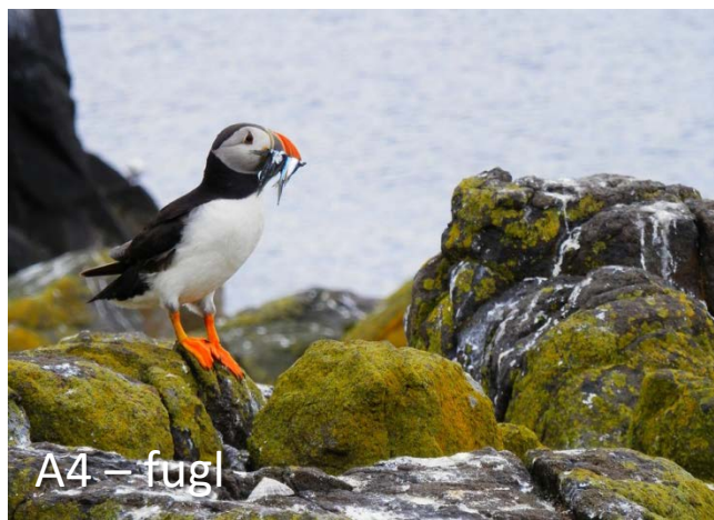
A4 – fugl