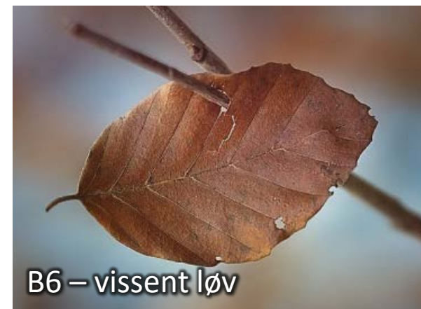
B6 – visst løv