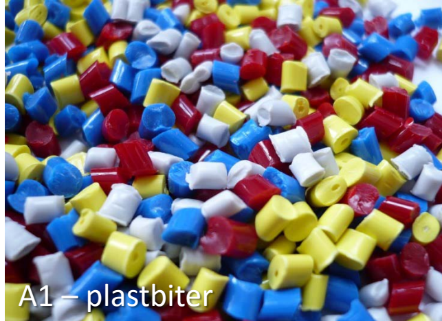
A1 – plastbiter