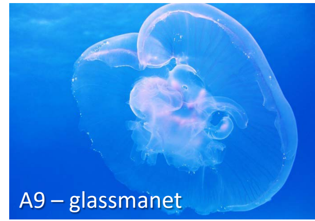
A9 – glassmanet