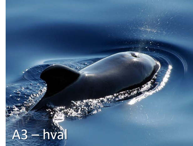
A3 – hval