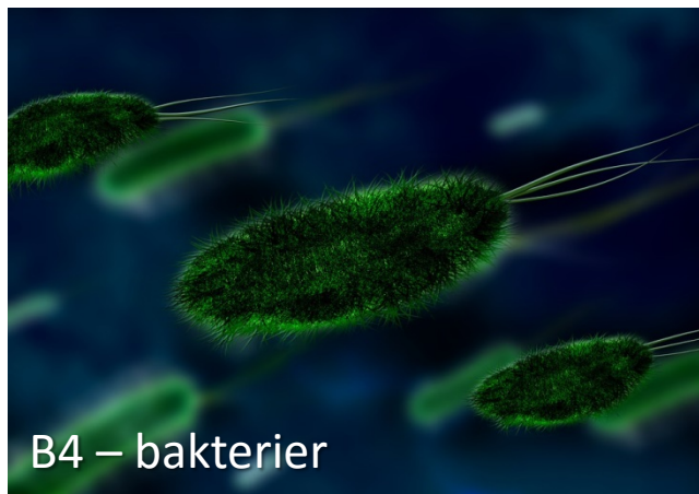
B4 – bakterier