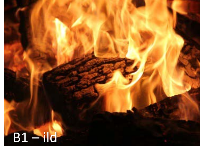
B1 – ild