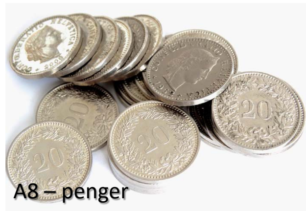
A8 – penger