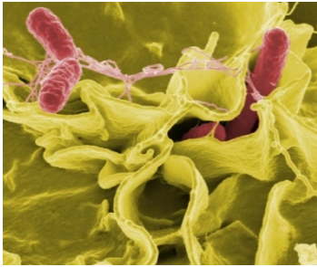
Salmonellabakterier, farget røde.

En dame ved navn Mary Mallon har gitt oss en tragikomisk historie om tyfoidfieber. Mary var bærer av bakterien Salmonella typhi som gir tyfoidfieber, men uten å ha symptomer. Uheldigvis jobbet hun som kokk for flere familier i New York i begynnelsen av 1900-tallet. Håndhygiene var visst ikke hennes greie, så hun delte med seg av bakteriene fra sin egen avføring til de menneskene hun laget mat til. Etter flere utbrudd av tyfoidfieber, klarte leger i New York å føre sykdommen tilbake til Mary. Hun fikk etter hvert kallenavnet Tyfoid-Mary.